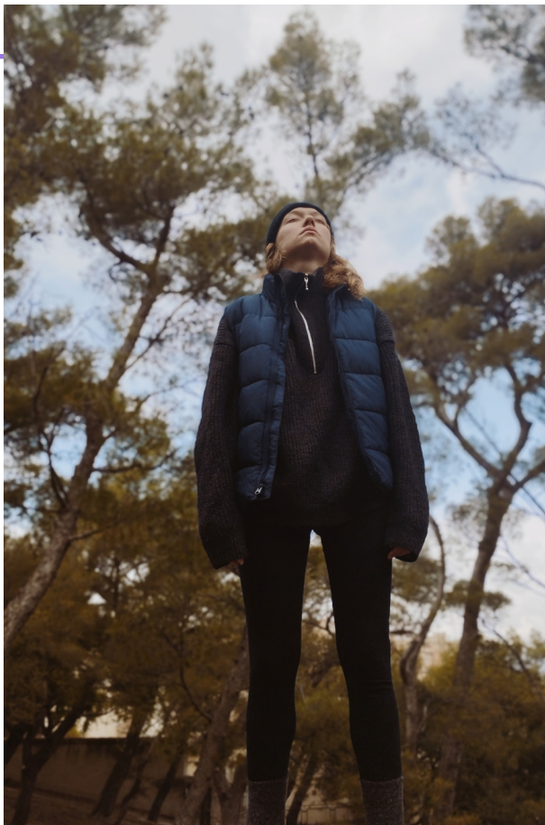
© Extrait de Chien-Fusil , pièce de théâtre d'Athéna Amara, lauréate en 2022

Cet appel souhaite soutenir les jeunes créateur.ice.s et accompagner les nouvelles générations d'artistes. En complément aux enseignements existants, le dispositif a pour objectif de contribuer à la formation et à la professionnalisation des étudiant.e.s et jeunes diplômé.e.s.