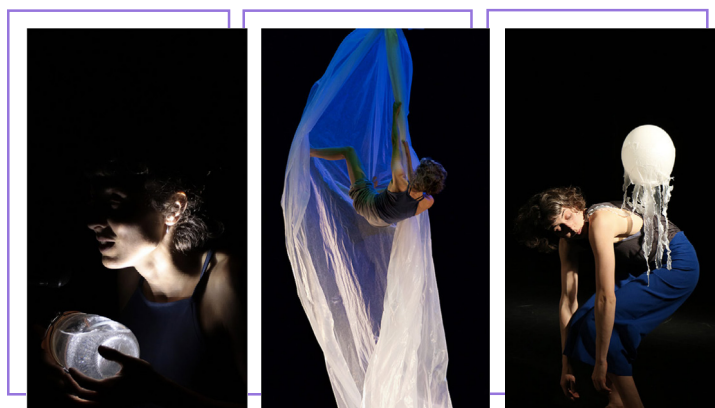
© Extrait d' Ici commence la mer , création circassienne de Lucie Muller, lauréate en 2022