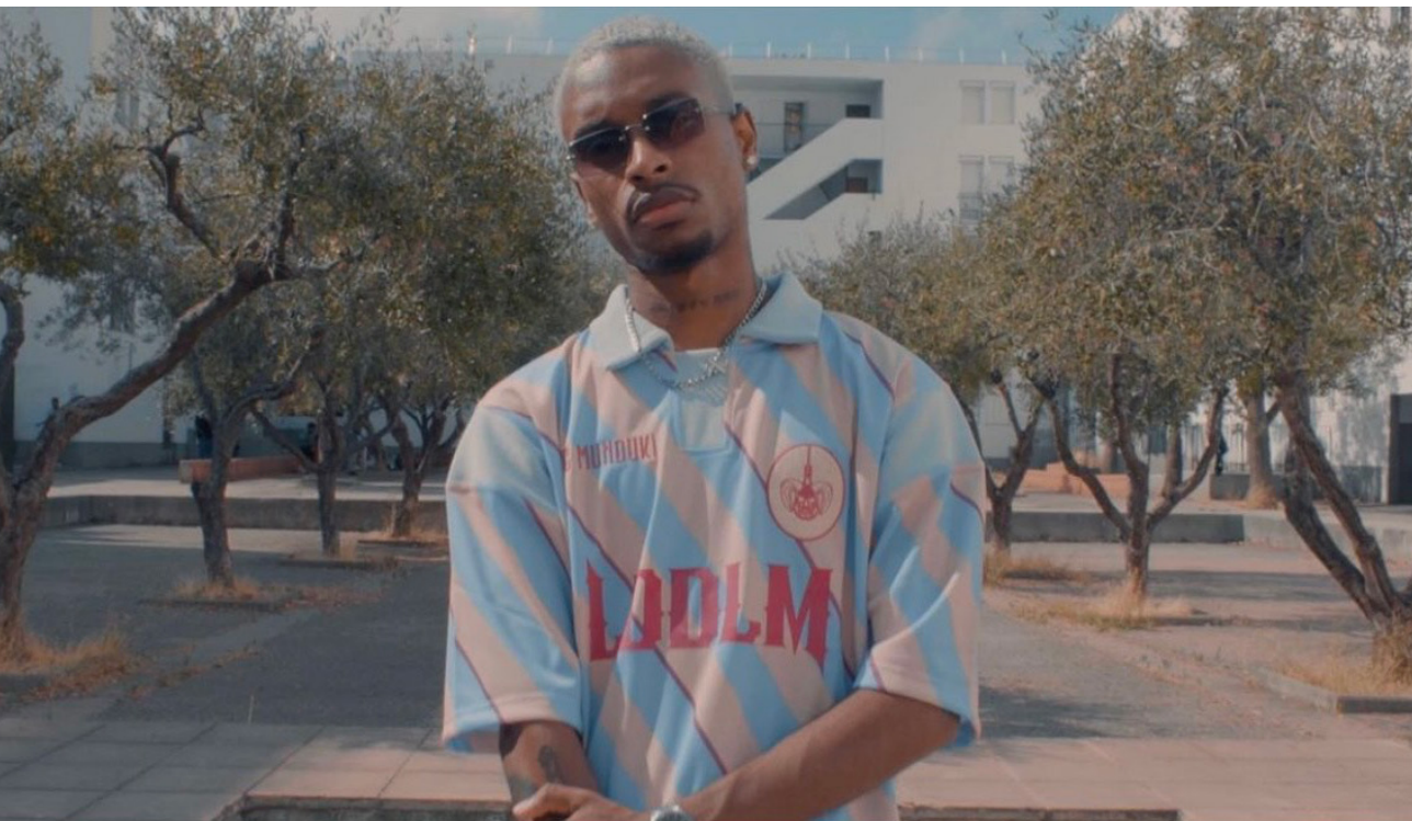
© Keziath Ba Ramos, lauréat en 2023 pour la pièce chorégraphique 17 Janvier